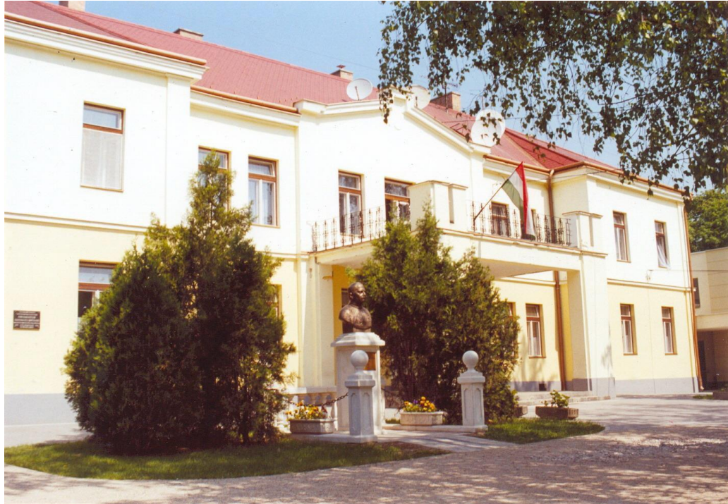
Dr. Batthyány-Strattmann László Általános Iskola